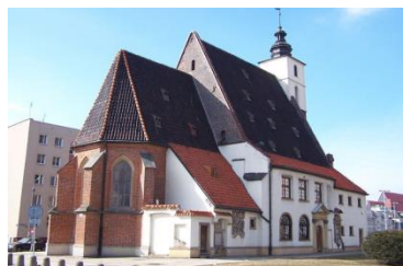
Evangelický kostel sv. Kryštofa ve Wroclawi

dvojazyčné bohoslužby ve Wroclawi, Śwydnici, Jaworze, Legnicy a Sycoiwie