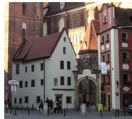
Domky Jeníček a Mařenka na Rynku

V ceně je ubytování na vysokoškolských kolejích, strava od pátku večer do neděle ráno a jízdenka na celý víkend po Wrocławu. Začátkem r. 2014 rozešleme do sborů další informace k přihlášení. Ekumenické oddělení uvítá ale již předtím informaci o Vašem zájmu – zejména pokud uvažujete o hromadnější účasti z Vašich sborů či seniorátů. V takovém případě doporučujeme domluvu ohledně společné dopravy. Vítána je také Vaše ochota jakkoliv pomoci – finanční podpora, dobrovolná služba, technická pomoc apod. Do konce listopadu 2013 ještě ekumenické oddělení přijímá návrhy na příspěvky do programu (kapely, hudební tělesa, výstavy, iniciativy na tržiště možností, přednášky k tématu apod.)